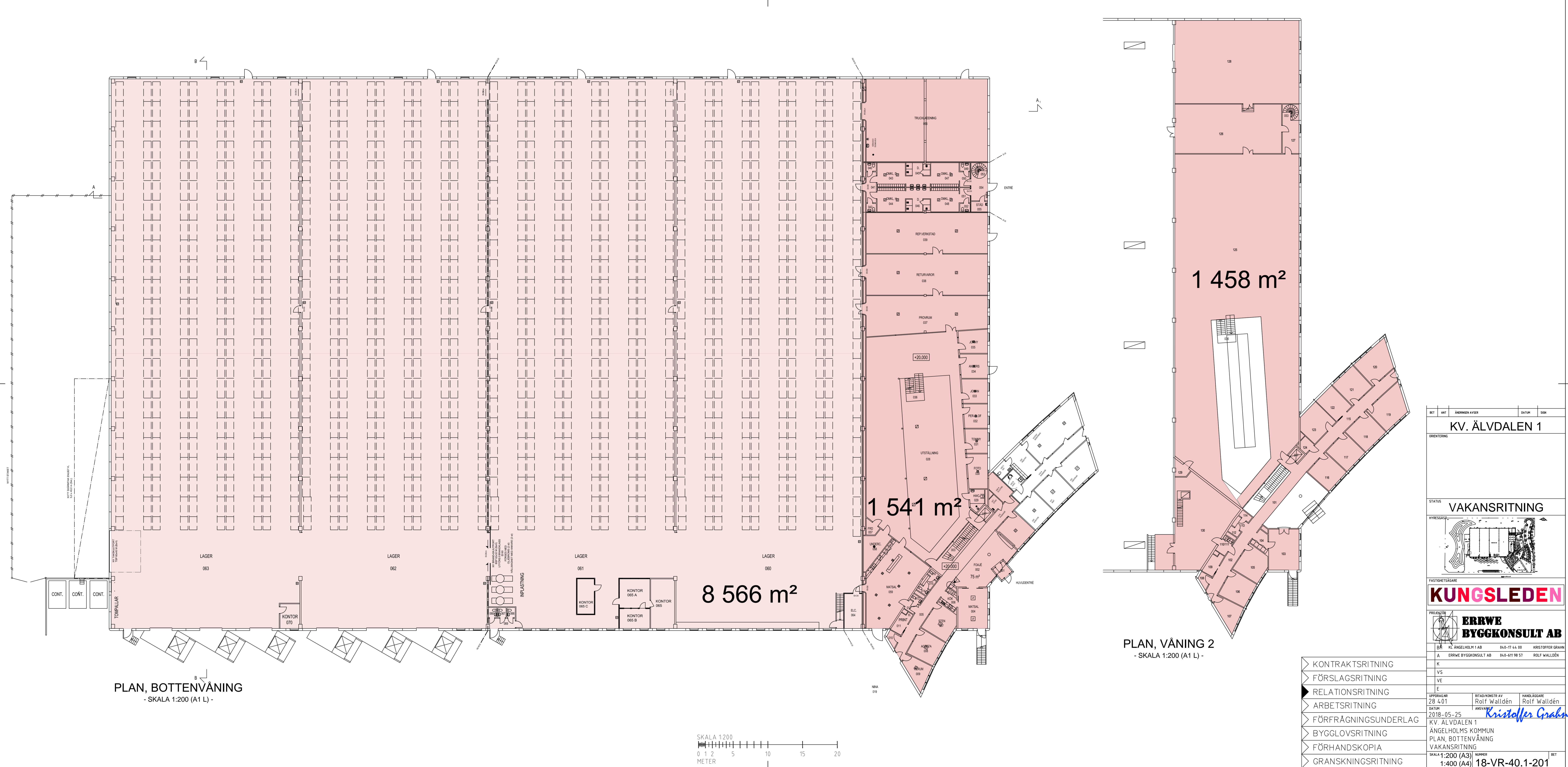
PLAN, BOTTENVÅNING - SKALA 1:200 (A1 L) -