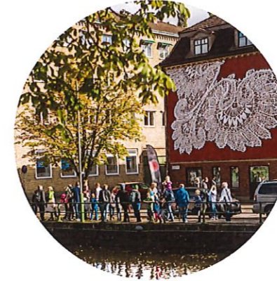
1. Centrum, Stadsparken & Viskan