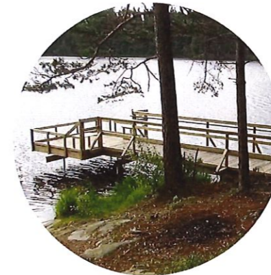
2. Pickesjön med naturområde