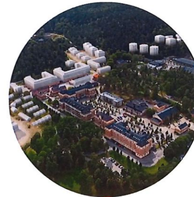
3. PEAB Utveckling Regementsstaden