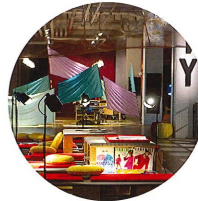
4. Borås textilmuseum