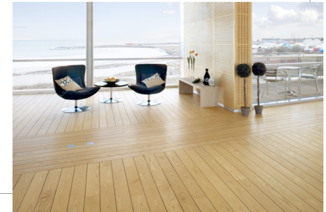
Skeppsgolv mellan kontoren