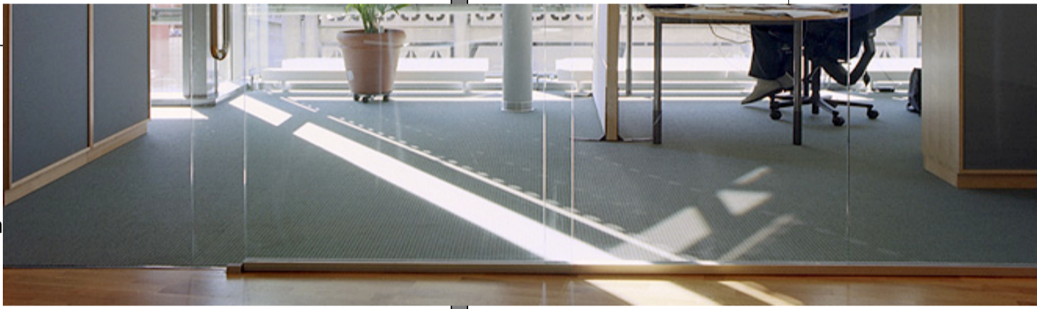
Önskad konf. Ikkab