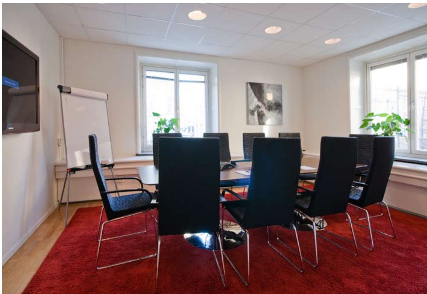
Exempel på konferensrum