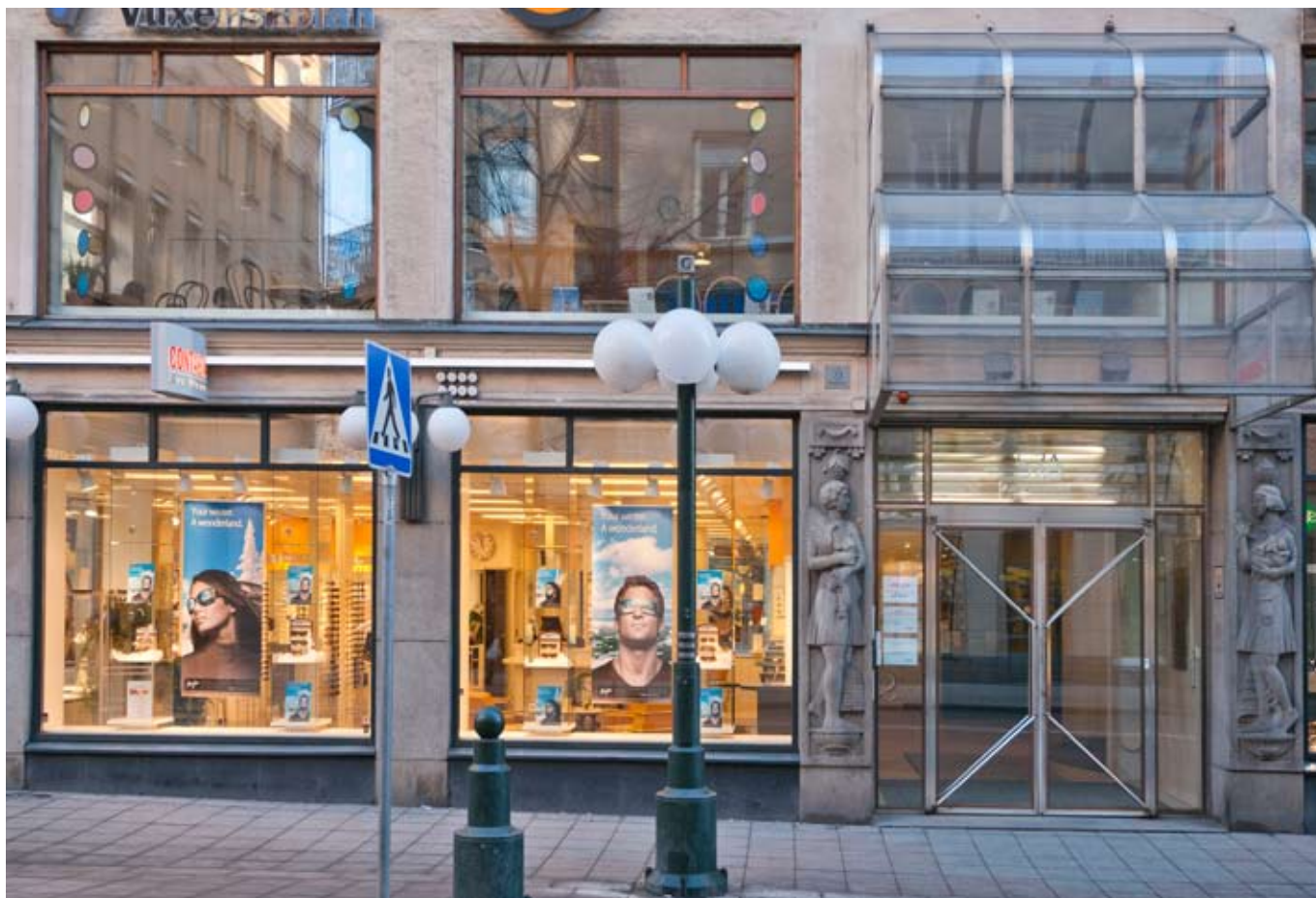
Entré på Kungsgatan