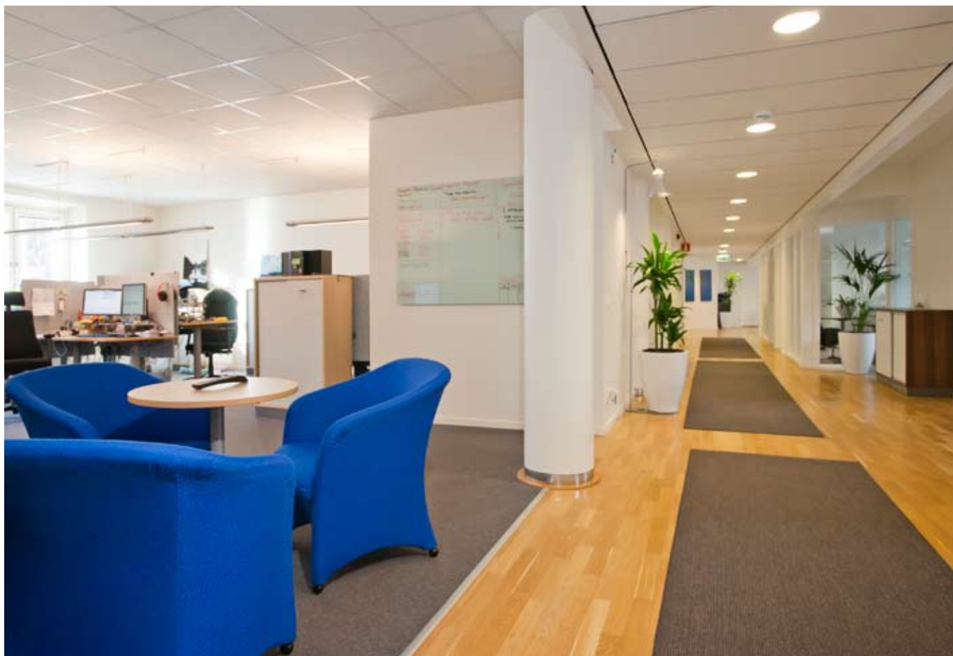
Exempel på landskap och korridor