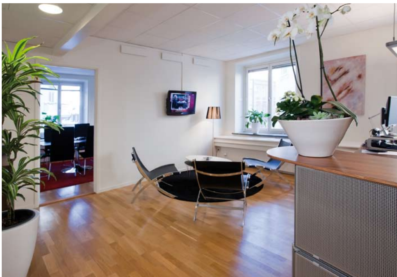
Exempel på reception